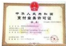
央行发放首批第三方支付牌照