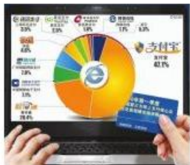
央行发放首批第三方支付牌照