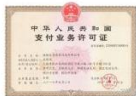
央行公布首批支付业务许可证 27家 单位获批